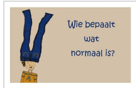
1 Kaartje uit de Praatprikkel: 50 filosofische vragen voor kinderen

Als je meerdere keren een gedicht hebt gelezen en na afloop de vragen hebt doorgenomen kun je dit thema afsluiten met de vraag 'Wie bepaalt wat normaal is?' Dit gesprek begint met het onderzoekspel 'Baas boven baas' waarbij je de eerder uitgeprinte foto's en de vellen papier met + en de - nodig hebt.