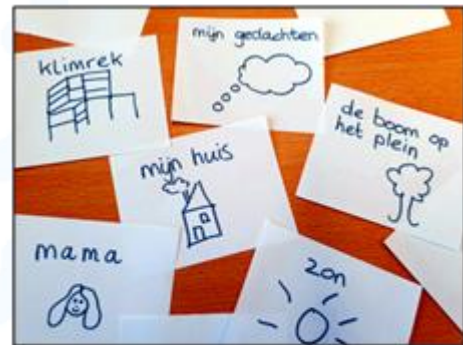
Schrijf het voor de jongste op en maak er een simpel en snel tekeningetje bij.

Je zou denken dat een steen niet verandert, maar dus toch wel. Denk eens na. Zou er iets bestaan wat nooit verandert?